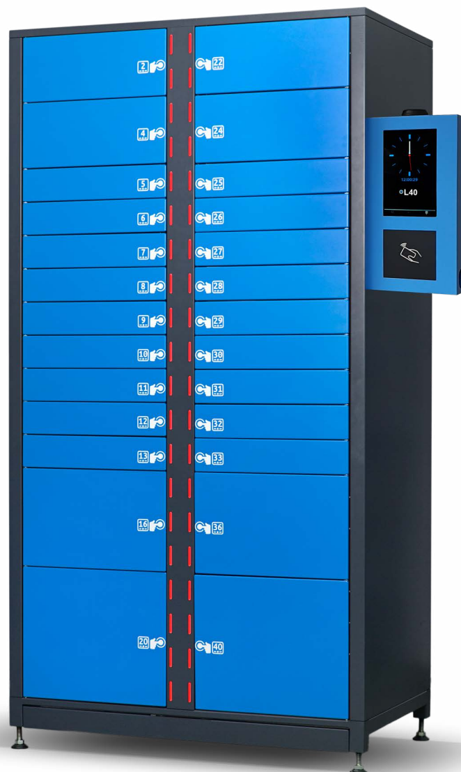
Automat dostępny w wersji BASIC oraz PRO

Dzięki funkcji regulacji półek – na wysokość , w 4 rozmiarach, do urządzenia można załadować nawet 40 produktów jednocześnie. Łatwa zmiana ustawień pozwala na każdorazowe dostosowanie pojemności automatu do aktualnych potrzeb eksploatacyjnych.